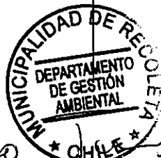
Firma Jefe Directo